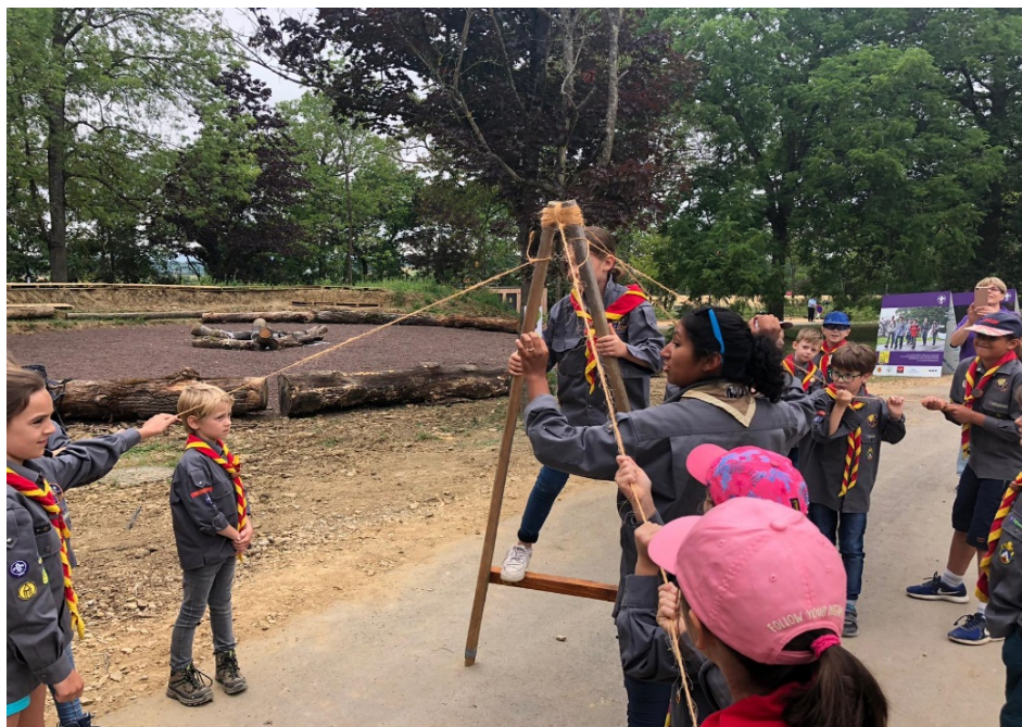
Um PowerWow 2019 zu Munneref

Dans le « Kéisblat », vous trouvez toutes les informations nécessaires concernant le groupe, ses activités, et bien plus. Il s'adresse à tous les membres, mais aussi à tous les parents. Il est important de le conserver pour ne pas manquer les dates des activités, etc. Vous pouvez aussi le trouver sur notre page Facebook et sur notre site « muma.lu ». Vous le recevrez également via courriel. La rédaction vous souhaite une bonne lecture.