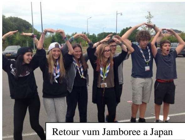
Retour vum Jamboree a Japan

Chaque scout a besoin d'amener lors de chaque activité , le manuel "Scoutsbichelchen un petit bloc et un crayon/stylo et naturellement toujours le foulard du groupe