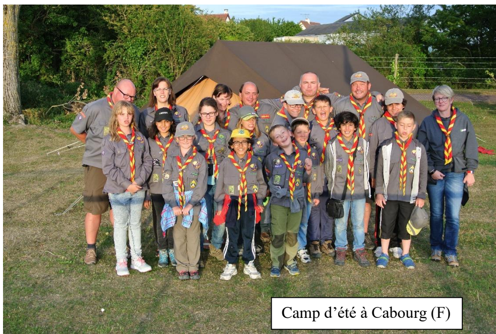
Camp d'été à Cabourg (F)

Ne pas oublier de payer les activités dans les délais requis, non plus !!